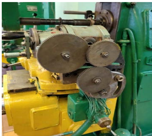
Рис. 1. Стандартный вид конструкции УДГ Д-160

Целью исследования являлась модификация конструкции универсальной делительной головки для фрезерования винтовых зубчатых колес с использованием метода дифференциального деления. В качестве объекта исследования была выбрана универсальная делительная головка УДГ Д-160 (рис.1)