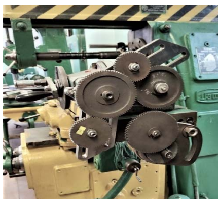
Рис. 3. Модифицированная конструкция УДГ Д-160

Вид модифицированной конструкции УДГ Д-160 представлен на рис. 3.